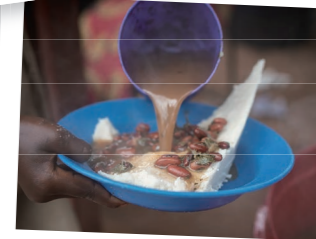
ブルンジ