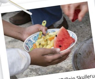
ブータン