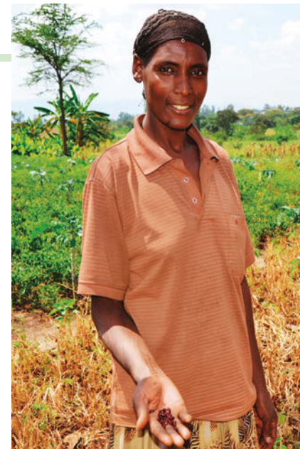
国連WFPが支援する農家

このような地産地消の給食の取り組みは、ホンジュラスやマラウイ、モザンビークなどでも行われ、拡大しています。