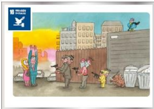
16 気候変動 あらゆる場所での暴力および脅力による死亡者を大幅に減らそう。