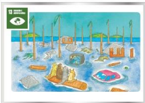
13 気候変動 気候関連災害や自然災害に対して、それぞれの強が力強く抵抗力を強化しよう。