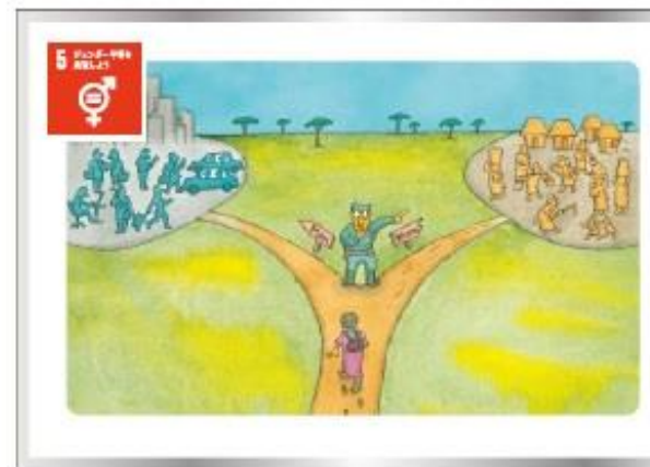
女性への早期結婚、強姦結婚などの慣習をなくし、社会への参画機会を増やそう。