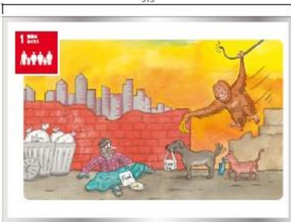
1日$1.25未満で暮らしている極度の貧困層をあらゆる場所からなくそう。