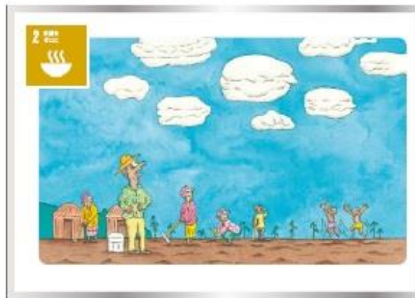
飢餓を終わらせすべての人が栄養ある食糧を十分に暮らせるようにしよう。