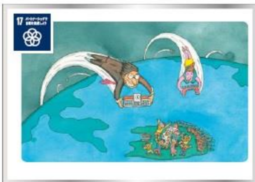
17 気候変動 先進国は開発途上国に対するODAをGNI比の0.7%と決めて達成しよう。