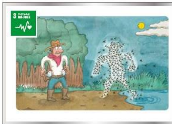
マalariaやエイズ、結核、その他の感染症などの伝染病を根絶しよう。