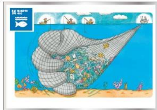
14 持続可能な開発目標 漁網漁法や漁法漁法などの従来の漁業を止めて、科学的な漁業管理を奨励しよう。