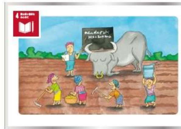
すべての子供が男女の区別なく質の高い教育を受けられるようにしよう。