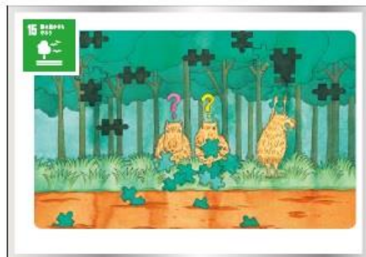
15 気候変動 森林減少を止めて傷んだ森林を癒さんだ森林を回復し、新しい森林を大幅に増やそう。